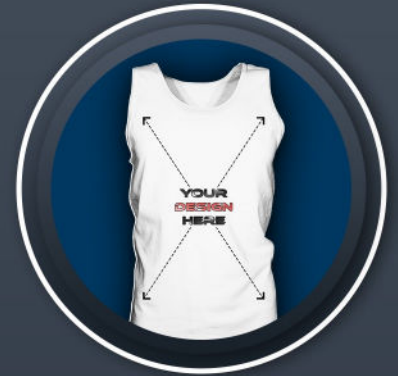
TANK TOP MALE *24,99 €