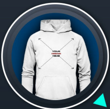
UNISEX HOODIE *49,99 €