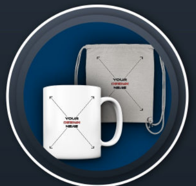
ORGANIC GYM BAG *19,99 € Tasse *15,99 €

*UNSER PARTNER PROGRAMM FÜR PREMIUM UND SHOP PARTNER BIETET EINE INDIVIDUELLE PREISREGELUNG.