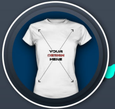
SHIRT FEMALE *24,99 €