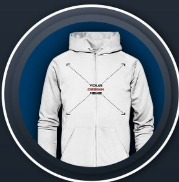
UNISEX ORGANIC ZIPPER *54,99 €