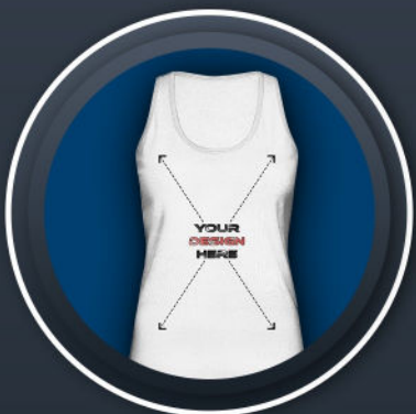
TANK TOP FEMALE *24,99 €