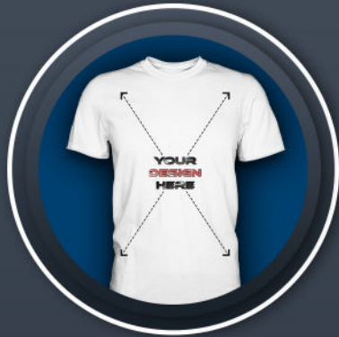
SHIRT MALE *24,99 €