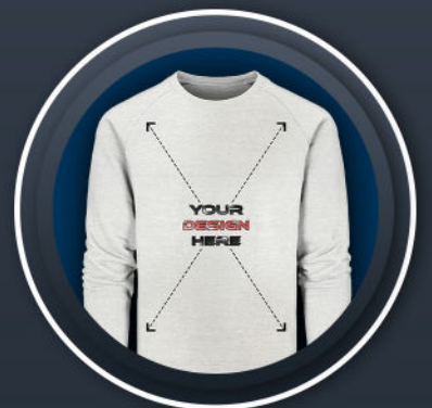
SWEATSHIRT FEMALE *44,99 €