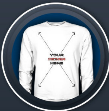
SWEATSHIRT MALE * 39,99 €